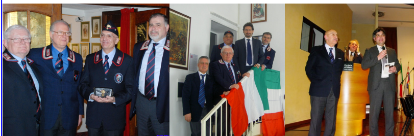
Senatore Gabriele Albertini EuroParlamento

Ottimi rapporti vengono mantenuti con i rappresentanti delle Istituzioni, sempre vicini ai nostri valori e convinti sostenitori del nostro essere un ponte ideale verso la Società Civile.